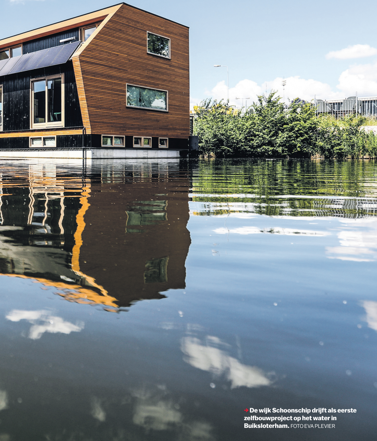
→ De wijk Schoonschip drijft als eerste zelfbouwproject op het water in Buiksloterham.

Op een overzichtsexpositie bij architectuurcentrum Amsterdam, een samenwerking tussen Urban Studies van de Universiteit van Amsterdam en het collectief Failed Architecture, wordt de balans opgemaakt. Welke architectuur hebben de experimenten opgeleverd? De voorzichtige conclusie kan zijn dat alles mogelijk is: van klassiek, postmodern tot ecologisch op het Steigereiland, tot luxueuze modernistische villa's aan de Weespertrekvaart. Daar staat ook een eigentijdse versie van Villa Kakelbont tussen.